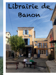
Librairie de Banon